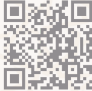
مواقع التواصل الاجتماعي