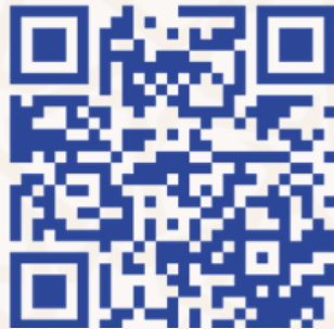
الدراسة القبلية للملفات