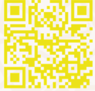
الإطلاع على وثائق التعمير