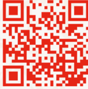
مذكرة المعلومات التعميرية