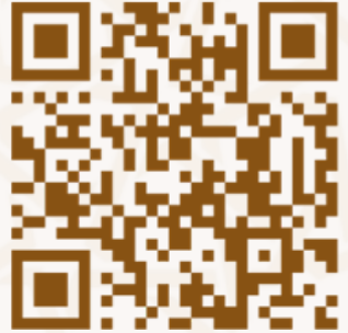
الأداء عن بعد